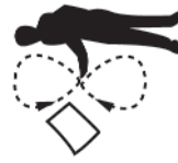
Drapeau agité en 8